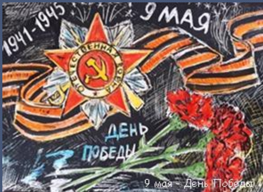
9 мая - День Победы