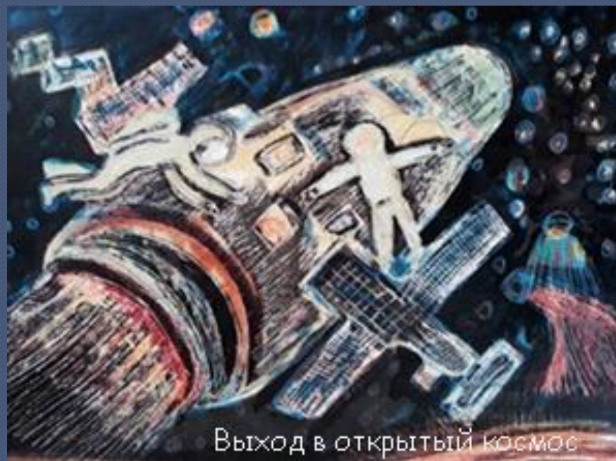
Выход в открытый космос