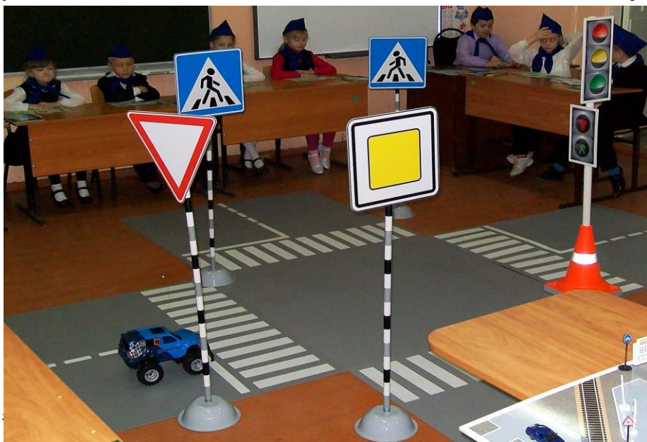
Фото на странице: 0